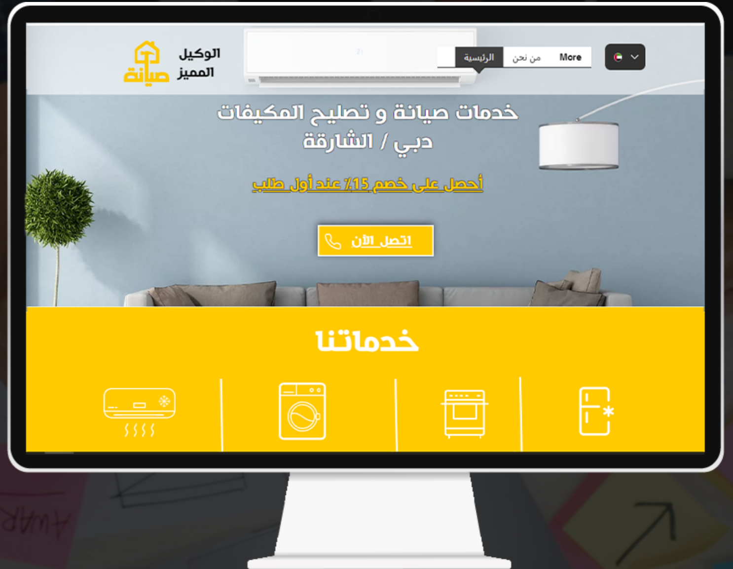
[ تصميم مواقع إلكترونية ]